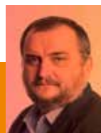
Josep Sort President de Reagrupament

Des de Reagrupament fem una crida a la mobilització, a la victòria, a la unió independentista. Guanyem i fem de les institucions i del carrer les nostres avantguardes de la Catalunya Lliure!